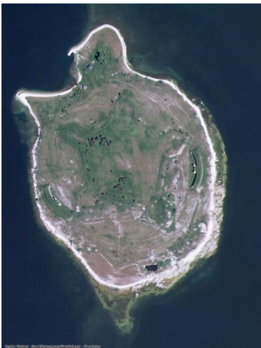
Slite Utveckling 201811mj